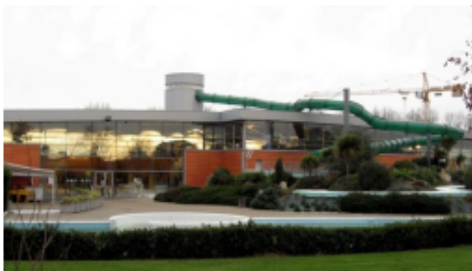
ESPACE NAUTIQUE JEAN VAUCHÈRE